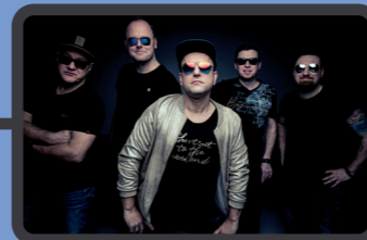
Biba und die Butzemänner 20.30, 21.30, 23.25 Uhr