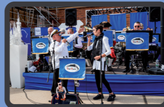
Die Thal-Saaler 14.05–14.45 Uhr