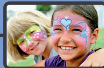
Haraldinos Kinderwelt 14.00–19.00 Uhr